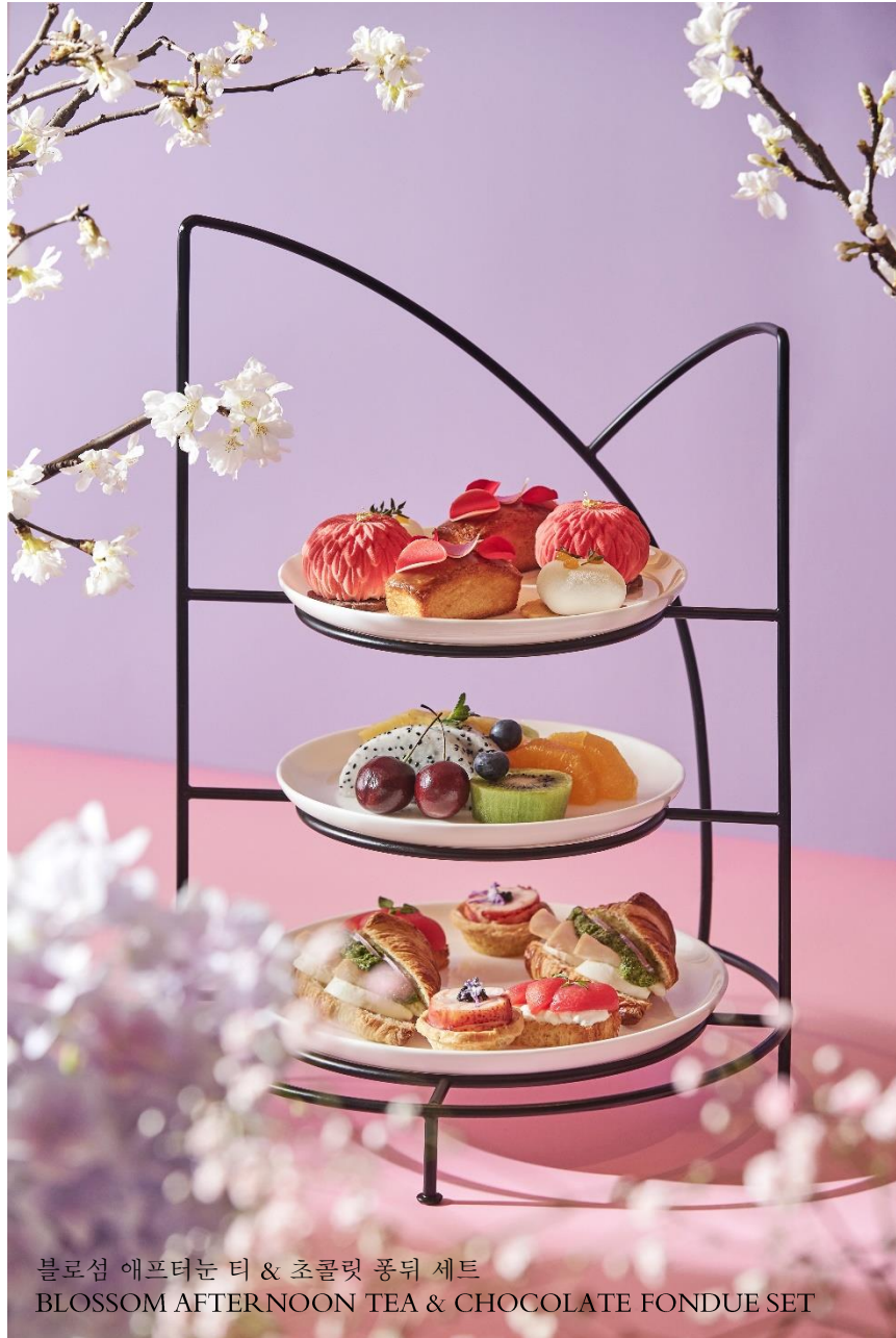
블로섬 애프터눈 티 & 초콜릿 풍뒤 세트 BLOSSOM AFTERNOON TEA & CHOCOLATE FONDUE SET