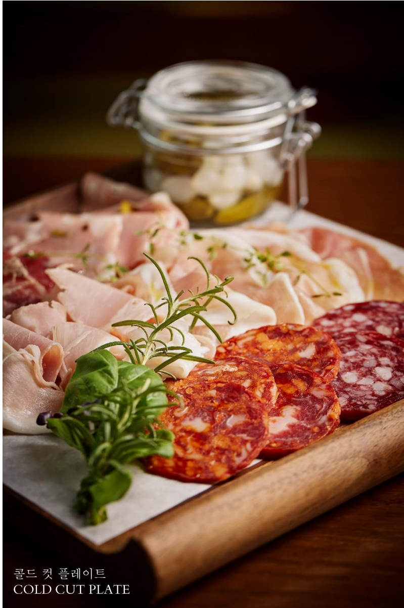
콜드 컷 플레이트 COLD CUT PLATE